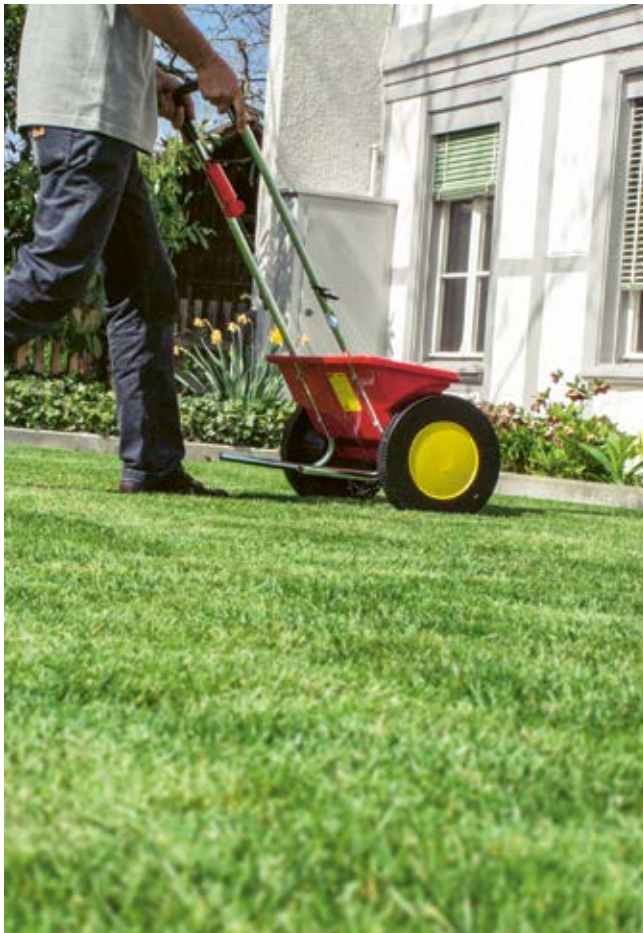
Dünger streuen im Frühjahr.

Im Herbst führen die kurzen Tage und die tiefen Temperaturen zu verlangsamtem Wachstum bei Gräsern. Darum empfiehlt sich eine erhöhte Kalium-Düngung zur Stärkung der Gräser für den Winter (z. B. Impact Herbst und Saat oder Expert Herbst).