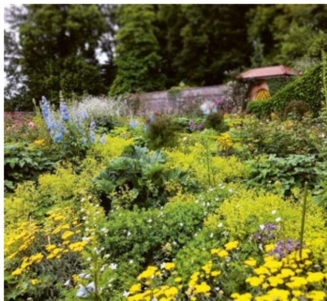
Die natürliche Langzeitwirkung ist eine grundsätzliche Eigenschaft der Bio-Dünger.

Alle erwähnten Produkte sind in der Schweiz vom Forschungsinstitut für Biolandbau zugelassene Hilfsstoffe (FiBL-Betriebsmittelliste).