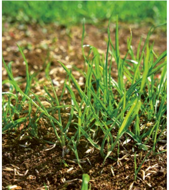
Gute Vorbereitung des Unterbodens und standortgerechte Samenmischungen erleichtern die Anlage eines schönen, pflegeleichten Rasens.