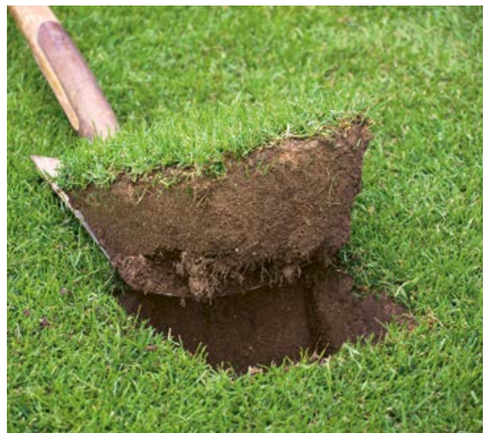
Mit einer Spatenprobe werden Boden- und Rasenqualität ermittelt – eine einfache Erfolgskontrolle zu den Pflegemassnahmen.