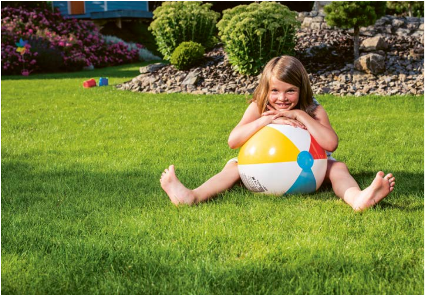
Ein gesunder und aktiver Boden ist die Grundlage für gesunde Rasengräser.

Organische Nährstoffe fördern die Bodenlebewesen, was sich positiv auf die Entwicklung der Bodenstruktur auswirkt.